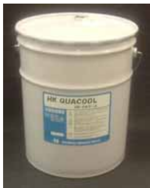
荷姿 : 20L ペール缶 / 200L ドラム缶