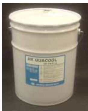
荷姿 : 20L ペール缶 / 200L ドラム缶