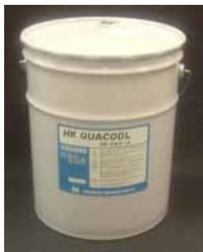
荷姿：20Lペール缶 / 200Lドラム缶

使用上の注意は容器表示を参照してください。詳しい取り扱い方法は「金属加工油剤使用ハンドブック」を参照してください。